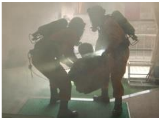
火災現場で煙の中を救助する訓練