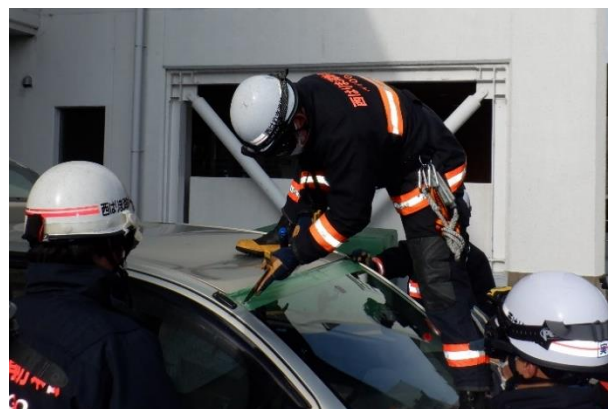
閉じ込められた人を救出する訓練